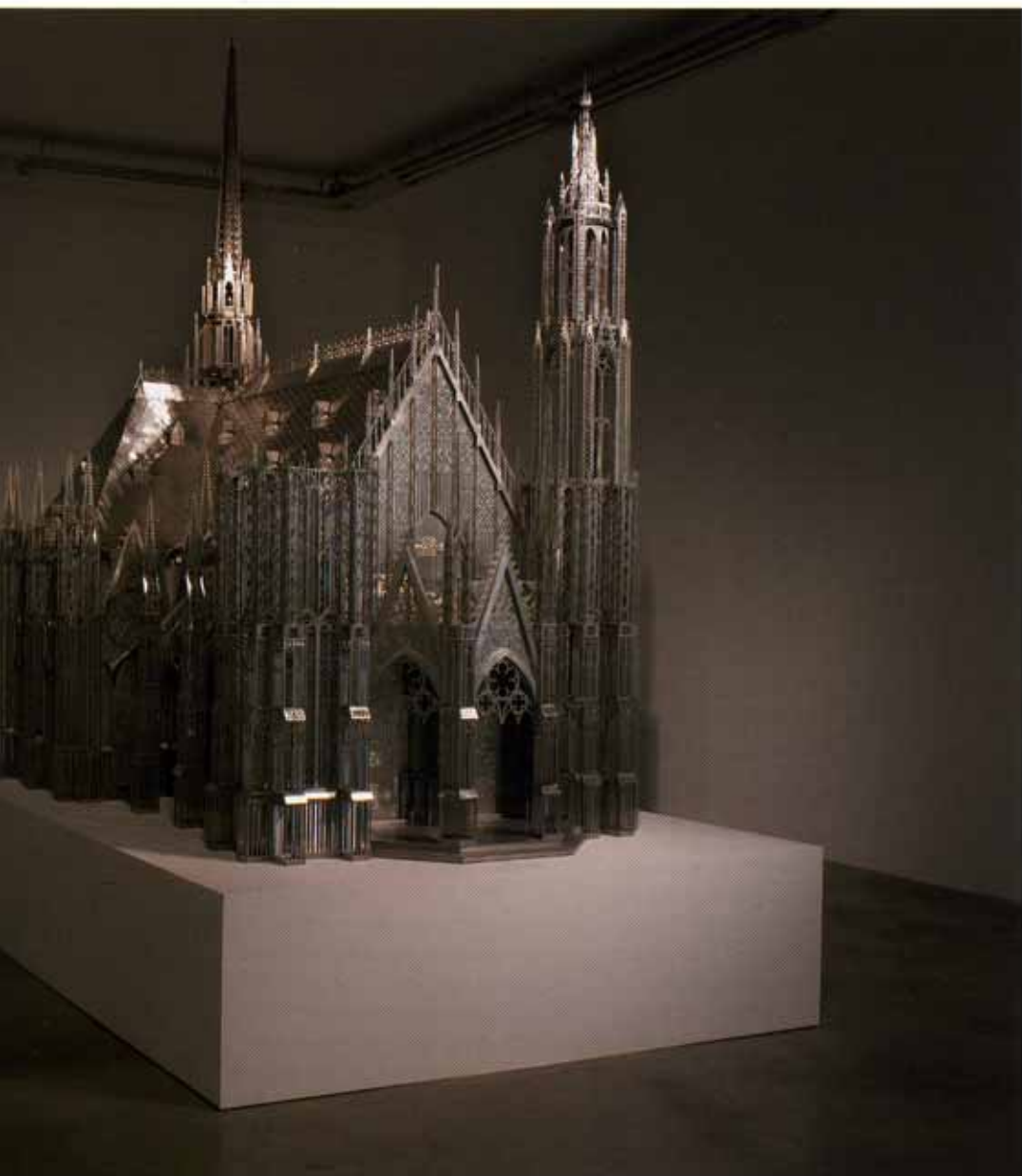
Exhibition view at Galerie Emmanuel Perrotin Paris