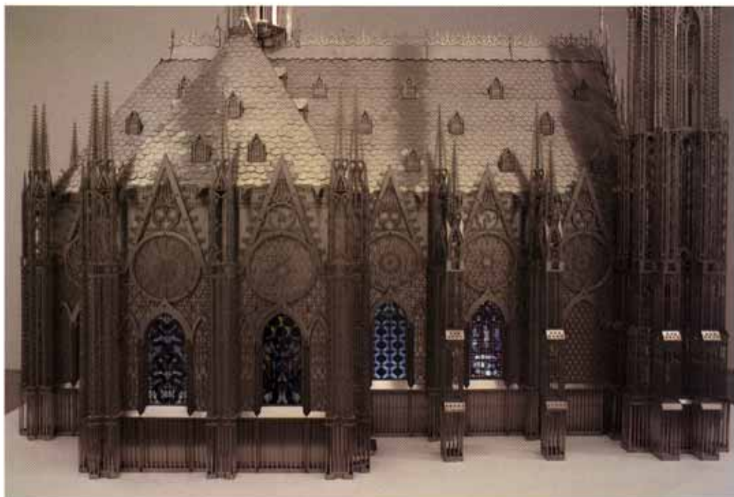
"Chapelle", 2007 Stainless steel 326 x 305 x 181 cm 10.8 x 10 x 5.11 feet

nothing. The females who go and select the best singing mate make up a jury of waste. We are the result of millions and millions of genetically successful seductions. And everything is wasted. The ornament, to an extent, is a form of waste. Shit is too, for everyone. This is the most cosmopolitan image in existence, more universal than Jesus or Coca-Cola.