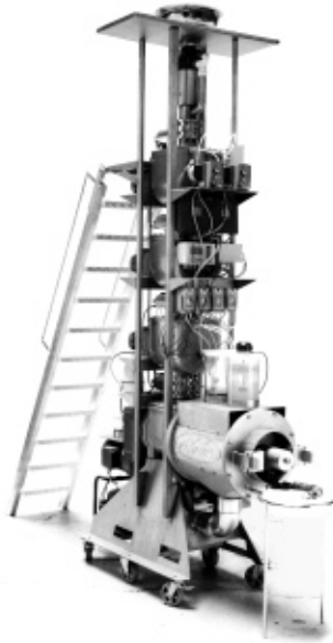
Cloaca No 5, 2006, mixed media, 330 x 390 x 70 cm

een man wiens rug hij tatoeëert. De overeenkomst houdt onder andere in dat de huid van de man na zijn dood “geogst” wordt en in het bezit komt van een Duitse kunstverzamelaar die het recht krijgt “het werk” te verkopen. Daarmee steekt Delvoye niet alleen Robert Rauschenberg naar de kroon, die van zichzelf zei dat hij werkte in de kloof tussen de kunst en het leven. Hij lijkt meteen ook de door hemzelf veel geciteerde thesissen van Oscar Wilde te onderschrijven, namelijk dat kunst esthetisch, maar nooit ethisch kan zijn.