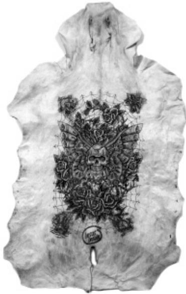
Untitled (Skull/Jesus Inside) , getatoeëerde varkens- huid, ingekaderd, 190 x 138,5 cm, Foto Studio Wim Delvoye, Gent.

Eigenlijk zijn ze essays, die onderwijl knorrend, pissend en schijtend de theorieën van Adam Smith en co. aanschouwelijk maken. Typisch voor Delvoye is dat hij in zijn beste werken complexe inhouden gebald weet vorm te geven. En ook in dit project volgt hij zijn vertrouwde procedé: hij pikt een element op uit de populaire cultuur (tatoeages) en plaatst ze op ongewone dragers.