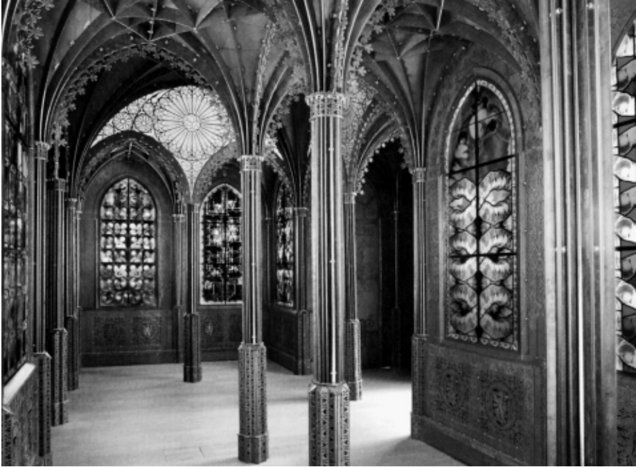
Chapelle , 2006, Mudam Luxemburg, lasergesneden Cortenstaal en Röntgen-afbeeldingen, 400 x 900 x 600 cm, Foto Studio Wim Delvoye, Gent.