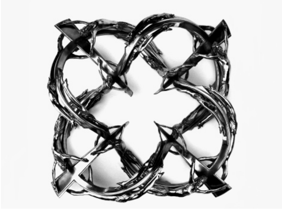
Double Helix DS 360 00 , 2008, Berlijns zilver, 30 x 118 x 121 cm, Foto Studio Wim Delvoye, Gent.

Ondertussen is hij ook al een tijd aan de slag met de beeldtaal van de lijdende christus en de doornenkroon. De figuren van de gekruisigde christus worden door de medewerkers van Delvoye getorst als een DNA-helixstructuur of verenigd in een ring. Deze vormen en bewegingen in gepatineerd brons roepen associaties op met oneindigheid en eeuwigheid, wat op zijn beurt Constantin Brancusi en zijn oneindige zuil in herinnering roept. Toen de Roemeense kunstenaar eens gevraagd werd naar de betekenis van zijn 29 meter hoge kolom, zei hij dat de zuil diende om de lucht te stutten. Ook Delvoye voegt een relativerende connotatie toe aan zijn getorste Christusbeelden door ze te vergelijken met een pretzel , het hapje dat in de vorm van een knoop wordt gebakken.